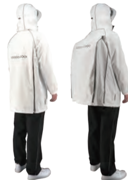
リュック着用前 リュック着用時