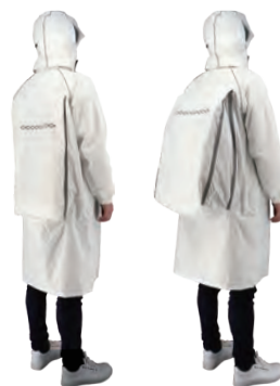
リュック着用前 リュック着用時