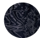
リフレクタープリント

透湿度：5,000g/m 2 ・24h以上 耐水圧：10,000mmH 2 O以上