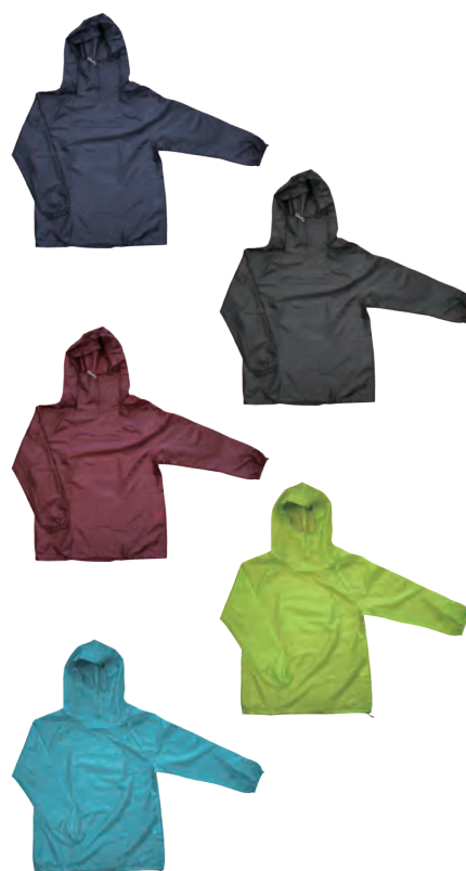
スタンダードなはっ水ヤッケ