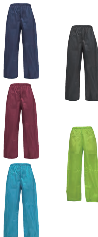
スタンダードなはっ水パンツ