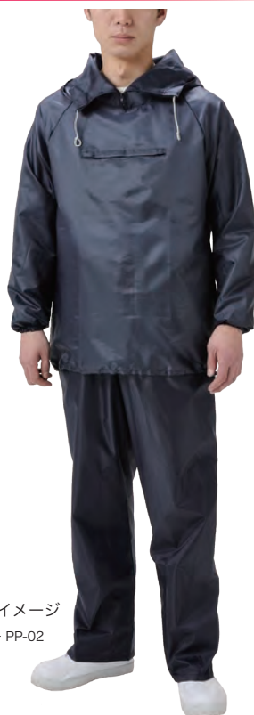
上下着用イメージ ※ PP-01 + PP-02