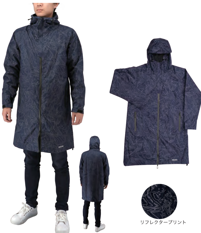
リフレクタープリント

透湿度：5,000g/m 2 ・24h 以上 耐水圧：10,000mmH 2 O 以上